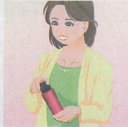
イラスト・宏和デザイン

今や日本で65歳以上の高齢者は4人に1人。年齢を重ねても人生をより豊かなものにしようという意欲にあふれた人も増えていきます。でも、誰しも思ったように体が付いてこないといった経験があるのではないのでしょうか。 花王の調査によると、高齢の女性で化粧をして元気に歩いているという人も「細かい字が読みにくくなった」「指先が思うように動かなくなった」「新しいことを覚えられなくなった」など多くの不便を感じて